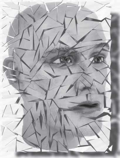
اعداد: صفية عبدالمطلب